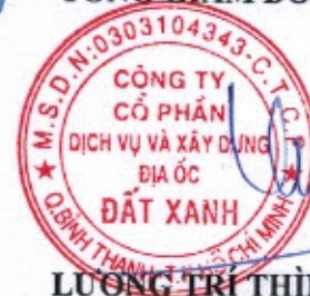
LƯƠNG TRÍ THÌN